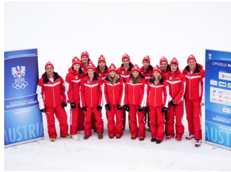
Team AT &amp; LIE